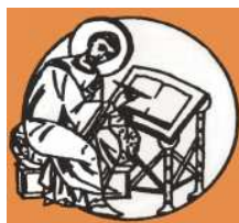
Collegio A. Volta