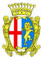
Comune di Lecco